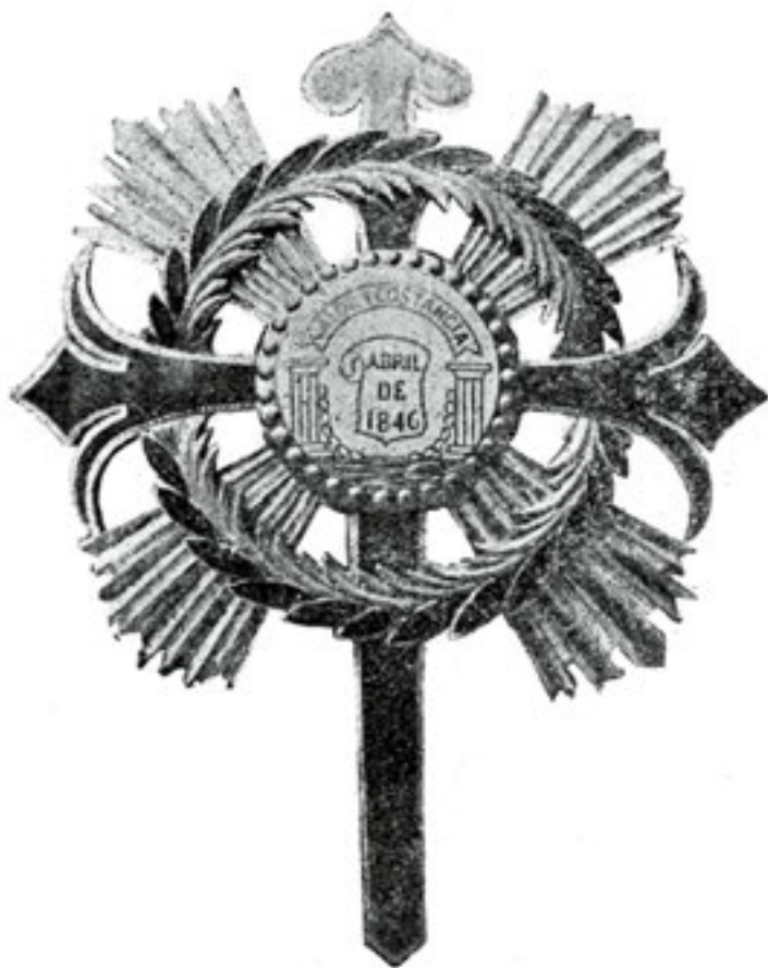
M. Chicharro, fot. Cruz de Valor e Constança