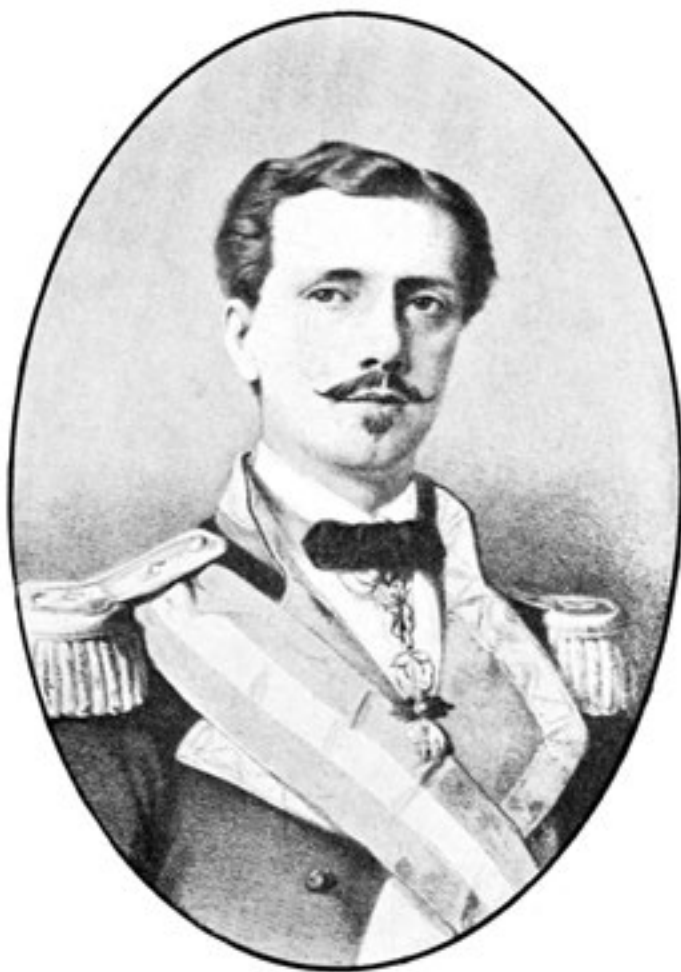
Retrato do Infante D. Henrique María de Borbón