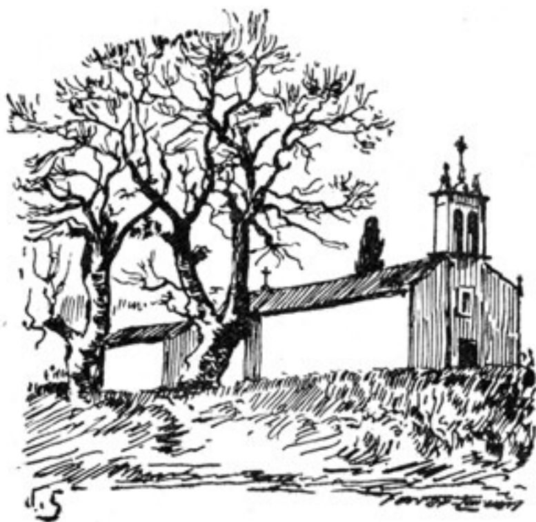
Carral: Igrexa de Santo Estevo de Paleo