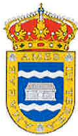
CONCELLO DE AMES