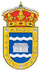
CONCELLO DE AMES