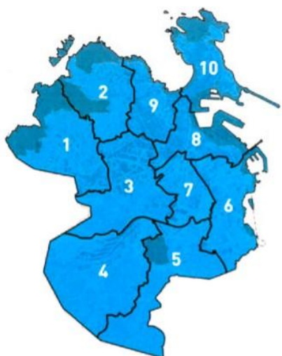
Imaxe 1. Representación gráfica dos distritos da cidade da Coruña.

Estudáronse e analizáronse en profundidade un total de 12 indicadores de control básicos para definir o estado de limpeza (e ambiental) do espazo urbano: