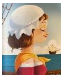
Isabel Zendal (Ordes, 1771)

“No consigues lo que deseas, consigues lo que trabajas y mereces”