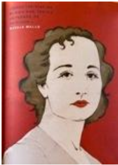
Maruja Mallo (Viveiro, 1902)

“Todos los días de mi vida han tenido un pedazo de felicidad