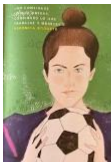
Verónica Boquete (Santiago, 1987)

Hai moitas mulleres galegas, valentes que cambiaron o mundo. Elas loitaron polo que realmente querían ser, sen convencionalismos. Saberías sinalar a que profesión dedicouse cada unha delas? Se acertas recibirás un agasallo!